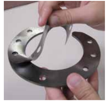
Couches faciles à peler. Les couches détachées inutilisées peuvent être réutilisées dans un autre assemblage.

Jeux de cales collées sur les bords montés sur un assemblage couronne et pignon d'engrenage d'essieu.